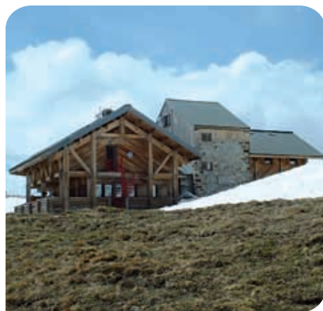
Refuge du Col de la Croix du Bonhomme

Situé sur un passage très fréquenté, entre le val Montjoie et la vallée des Glaciers, ce refuge offre aux randonneurs un confort très appréciable et un superbe panorama.