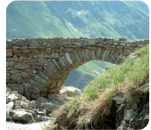
Pont de la Raja